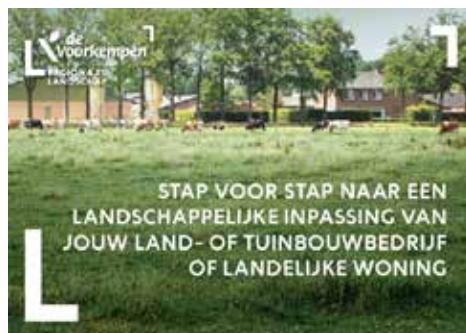
De brochure kan je downloaden via www.rldde-voorkempen.be .

Samen met de gemeenten Brecht, Essen, Kalmthout en Wuustwezel ontwikkelden we een nieuwe methodiek om landbouwbedrijven beter te integreren in het landschap. De methodiek is ook hanteerbaar voor particulieren die landelijk wonen. Tussen 2016 en 2018 werden 27 adviezen en plannen opgemaakt.