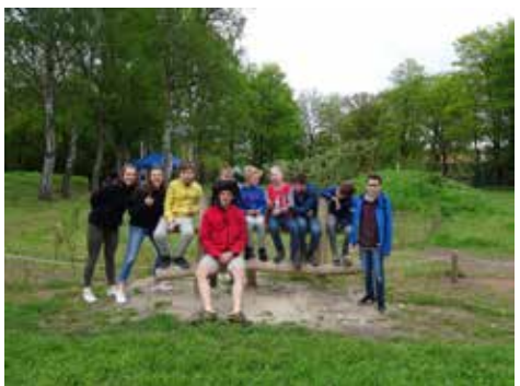
Opening speelnatuur in Brasschaat

Ruimte om te ravotten in de natuur, we krijgen er niet genoeg van! We werkten verder in Ekeren, openden een stoerwoud in Essen en maakten plannen voor De Dorens in Loenhout. In Brasschaat kan je voortaan terecht aan de Licht Vliegwezenlaan en ook de Dwergenbergen in Zoersel groeide nog verder uit.