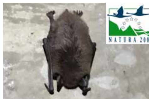
Vleermuis in een bunker van het Wolvenbos

Bunkers, schansen, forten, oude bomen, kerkzolders, ... In 2018 werden weer heel wat verblijven voor vleermuizen ingericht in samenwerking met verschillende partners.