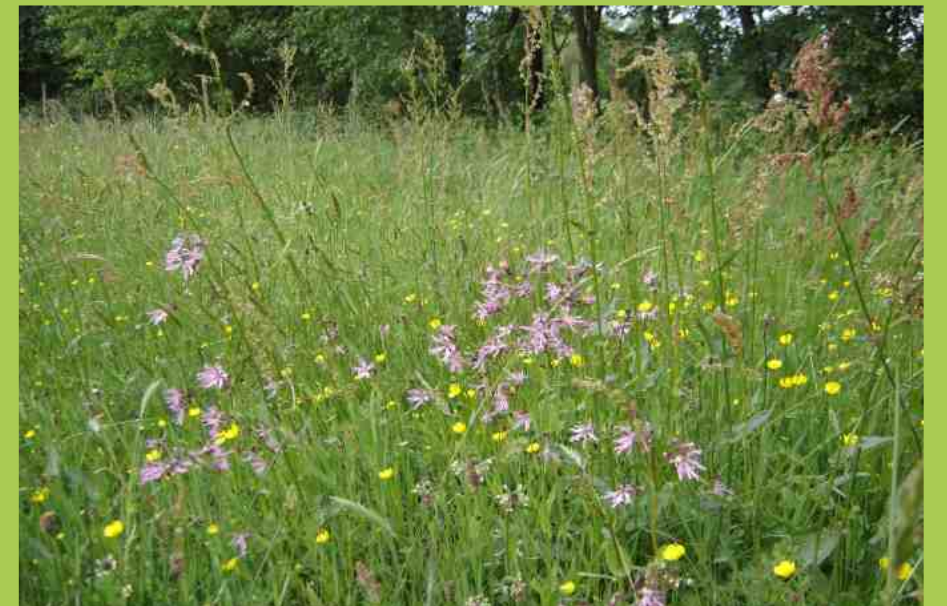
Een bloemrijk hooiland is de ideale plek voor heel wat insecten.

Een gevarieerd insectenleven levert een bijdrage aan het biologisch evenwicht in het groen. Veel soorten insecten leven van andere soorten insecten. Ze reguleren daarmee de populaties van die soorten. Hoe gevarieerder de fauna, hoe meer het systeem zichzelf reguleert. Voor een gevarieerde fauna is echter een gevarieerde begroeiing nodig.