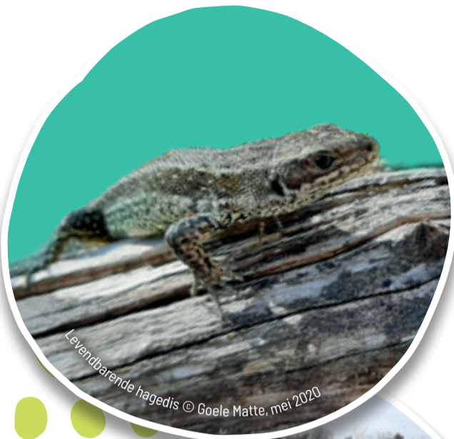
Levendbarende hagedis © Goele Matte, mei 2020

In het Drijhoeksbos in Schilde ligt een natte laagte met overblijfselen van dopheide, struikheide en veenpluis. Dat is een biotoop om te koesteren. Met de jaren nam gras de overhand. Tijd voor actie!