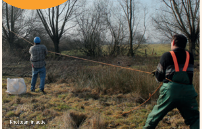
Knotteam in actie

Dat kan! Je krijgt een cursus en de ancients leren je de kneepjes van het vak. Het hout en kameraadschap krijg je er gratis bij. Meld je aan op info@rldevoorkempen.be