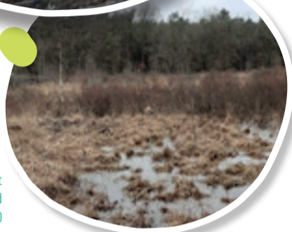
Vergraste heide met gagel op de achtergrond © Goele Matte, maart 2020