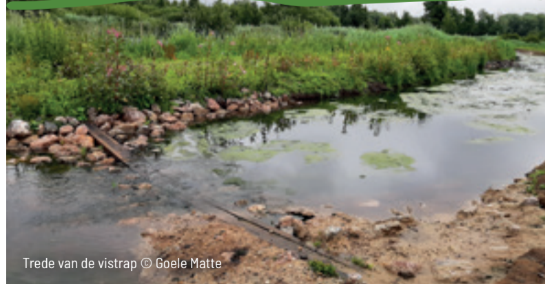
Trede van de vistrap