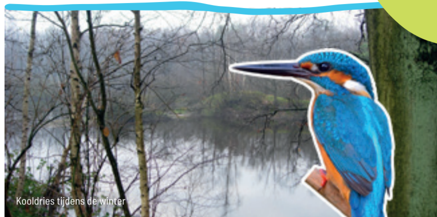
Kooldries tijdens de winter