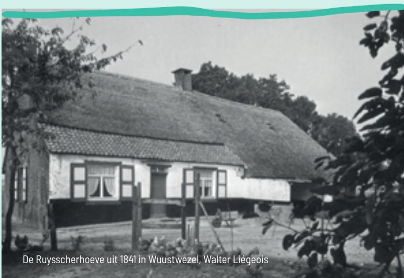
De Ruyscherhoeve uit 1841 in Wuustwezel, Walter Liégeois

Hoeves met stallen en bijgebouwen zijn typisch voor onze streek. Met het project 'Vakwerk/Netwerk' gaat Erfgoed Voorkempen eigenaars helpen met het onderhoud en de conservering van hun hoeve.